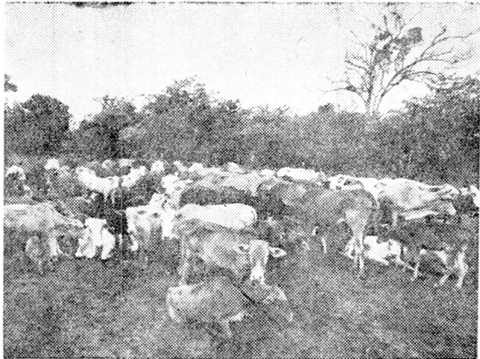
විල්ලුවලට දක්කනතුරු රැ ගාලක

කිරි කළ දෙකක් කෙරේ තබා ගත් කෙසඟ ගැටියෙක් හෙමින් හෙමින් කිරි එකතු කිරීමේ මධ්‍යස්ථානයට පා නැඟුවා. කිරි කළ බිම තැඹු ඕහු මෙතක් කැසකවා ගෙන තිබූ සරම පහත දමමා. මම හැතැප්ම හතරක් ම මේ විදිහට ආවා. කිරි දීලා ආයේ ම ඔය දුර යන්න ඕන. උදේ හතරට නැගිටලා කිරි දෙවා ගෙනයි මේ එන්නේ. මේ විදිහට කරන්නේ, කඳෙන්, බයිසිකල් වලින් කිරි භාජන මධ්‍යස්ථානයට ළඟා උනා.