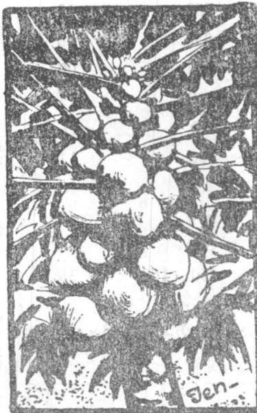
පලතුරු වලටත් එය ආධාරවේ.

1979 දී ආරම්භ කෙරුණ මෙම වැඩ සටහන ක්‍රියාත්මක කරන ලද්දේ ලංකා බැංකුව හා මහජන බැංකුව මගිනි. ගිය වසරේ අක්‍රීය යානු ඕෆර්සිස් බැංකුවද මෙයට එක්විය. මෙම ණය යෝජනා ක්‍රමයට ඉල්ලුම් කළහැක්කේ ඉළුම් අයිති කරුවන්ට හෝ මෙම ණය කාල සීමාව තුළ ඉඩම් බද්දට ගෙන ඇති අයට පමණි.