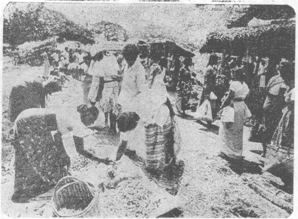
පාලනයේ යුතු කමක්: මෙබඳු සේ වා නවන් දියුණු කළ යුතුයි

එහෙත් අවාසනාවකට මෙන් කාලයක් බටහිර අධිරාජ්‍යවාදයට ගොදුරුවී තිබීමේ ප්‍රතිඵලයක් වශයෙන් අපේ රටේ එම නිලධාරී ක්‍රමයේ දැඩි වෙනස්කම් ඇතිවිය. මුල් අවස්ථාවේදී අපේ රටේ අධ්‍යාපන ක්‍රමය සකස් වූ පිළිවෙලට හාත් පසින්ම වෙනස් ක්‍රමයක් යටතේ යටත් විජිත පාලනය තුළින් අධ්‍යාපන ක්‍රමය සකස් වීමට පටන් ගති. බටහිර අධ්‍යාපන ක්‍රමය තුළින් හික්මීමක් ලැබූ බටහිර සංස්කෘතියේ වර්ගාධර්ම, අගනාකම සිරිත් විරිත් ආත්මීකරණය කරගත් එම පිරිස කිසිකලකත් දේශීයත්වය වෙත නැඹුරුවීමක් සිදු නොවූ අතර මේ නිසා නිලධාරීවාදයේ අති දුෂ්කර ප්‍රතිඵල ක්‍රමයෙන් අපරාධ තුළටද එබී බලන්නට විය.