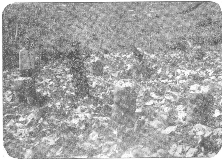
නිහාල්ගේ කණ්ඩායම ගෝවා අස්වැන්න නෙලද්දී

එහෙත් එයින් ඔවුන්ගේ ප්‍රශ්න නැවතුනේ නැත. වගාවට අවශ්‍ය අනෙක් ද්‍රව්‍ය—රෝපන ද්‍රව්‍ය—කෘෂි රසායනික ද්‍රව්‍ය ආදිය ලබා ගැනීමට අවශ්‍ය විය. ඒ සඳහා ඔවුන්ට වෙනත් සුළු සුළු රැකියාවල නියැලී මුදල් උපයා ගැනීමට සිදුවිය.