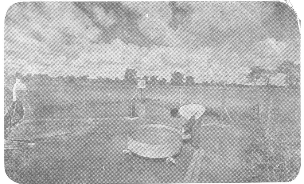
මනා ජල පාලනයක් සඳහා උවමනා වන උපකරණ කිහිපයක් වෙල්යාය මැද සවිකර ඇත. (වමේ) සන්දින වර්ෂාපතන මාපකය, (මැද) දෛනික වර්ෂාපතන මාපකය, (මැද ඇතින්) වැස්සක් පිළිබඳව කල්තබා අඟවන ආර්ද්‍රතා මාපකයක් ද සහිත සුළඟේ වේගය දක්වන උපකරණය, (මැදළහින්) දෛනික ජල වෘෂ්ඨි භවනය සටහන් වන උපකරණය