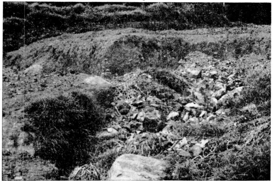
පරිසරය වෙනස් වන ආකාරය

'එක වරක් දූල හෙලිමෙන් ඇතැම් විට, මසුන් දෙතුන් සියය, ගොඩ ලා මරණ කිරිබබා, කුඩා දරුවකු දිවියකු දියෙහි දමනු දක හිස බද ගන්නේ කුහක කමින් නොවේ. ඔහු කුහකකම් නො දන්නා අවංකයකු වුවද පුරුද්ද නිසා ඔහුට මසුන් මැරීමේ වරද නොහැහෙයි.