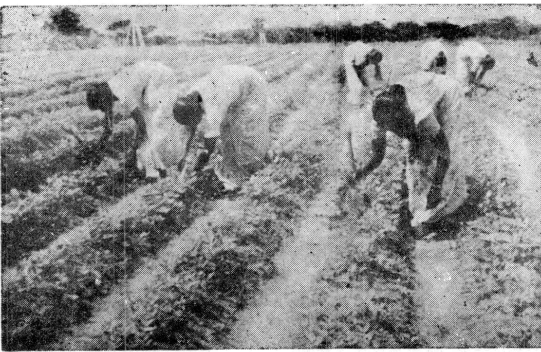
ග්‍රම සුලභතාවය ගැනද සැලකිය යුතු වේ

අලෙවිය සඳහා නිෂ්පාදන ක්‍රියාවලියෙහි ප්‍රශ්න නැත්තේ නො වේ. මෙම අවාසිදායක බලපෑම් කෙරෙහි මනා අවධානයක් යොමු කළ හොත් පමණකි, වෙළඳ පොළ සඳහා නිෂ්