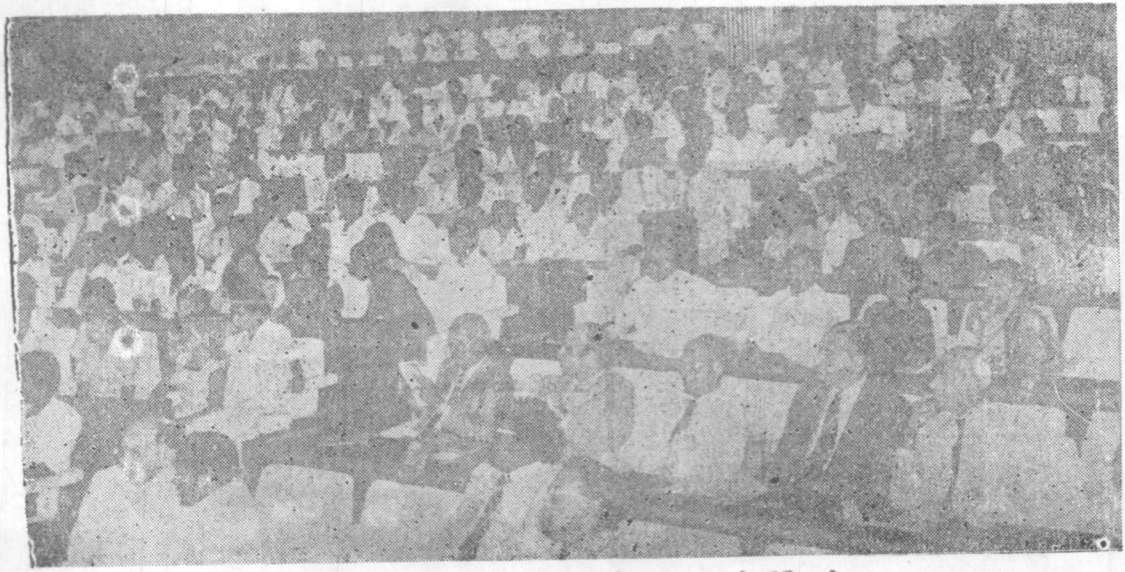
මහපොල උලෙලකට පැමිණි සිටි අමුත්තන් පිරිසක්

පසුව 1972 දී අංක 04 දරණ ශිෂ්‍ය (උසස් අධ්‍යාපන) ණය අරමුදල් පනත සම්මත වූණා. ඒ අනුවයි විශ්ව විද්‍යාලවලට මෙන්ම අනෙකුත් උසස් අධ්‍යාපන ආයතනවලට ශිෂ්‍ය ණය වාණිජ බැංකු මගින් නිකුත් කිරීමට පියවර ගත්තේ ‘පනතින් පසු බැංකුවෙන් ණය ලබාගැනීමේදී බැංකුවට පිළිගත හැකි ඇපකරුවන් දෙදෙනෙකු ඉදිරිපත් කිරීම වෙනුවට මව හෝ පියා හෝ භාරකරු හෝ ඇපකරු වශයෙන් ඉදිරිපත් කිරීමට හැකි වූණා මේ නිසා අඩු ආදායම් ලබන කාමරන් ශිෂ්‍ය ණය ලබාගැනීමට මග පෑදුණා. ශිෂ්‍ය (උසස් අධ්‍යාපන) ණය අරමුදල් පනත සම්මත වූ පසු මේ මහඟු කර්තව්‍යයට තවත්