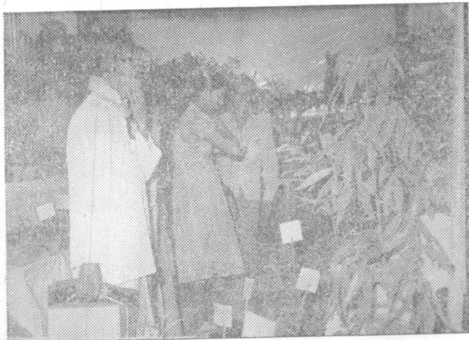
ප්‍රදර්ශනාගාරය තුළදී මාලෑටි පිළිබඳව පාරිභෝගිකයන්ගේ විමසිල්ල.

මහපොල ශිෂ්‍යත්වයේ තිබෙන විශේෂත්වය නම්, ආර්ථික අතින් අගහිඟකම් තිබෙන අයට පමණක් නොව උපරිම කුසලතා පෙන්වන ශිෂ්‍ය ශිෂ්‍යාවන්ද ශිෂ්‍යත්ව ලාභීන් වීම. අධ්‍යයන වර්ෂයකම කුසලතා මත පදනම් කර ගැනීමෙන්, ශිෂ්‍යත්ව සියයට පහළොවක් දෙනු ලබනවා. දකෂ-