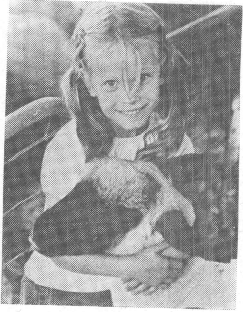
“මේ බලන්න. මා හඳුනා බැටළුවට පළමුවෙනි තැග්ග හම්බවුනා” ඇය 4-එච් සමාජයක ප්‍රබල සාමාජිකාවක්.