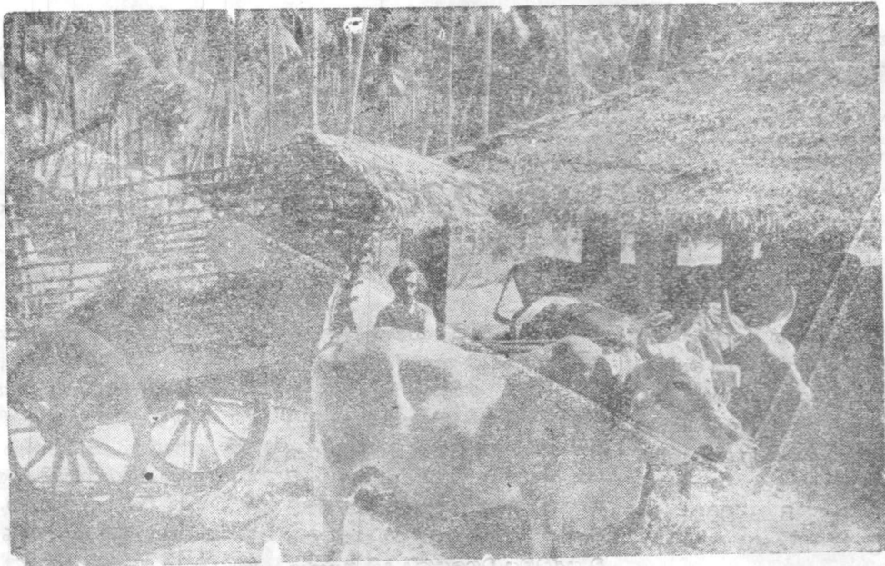
ගොවිතැන ලමන් මෙ ගැමි ජීවිතය: සමාජ වෙනසට හසුවී ඇත.

ගනු ලැබුවත් කටකම්වී භාවිතයට ගොවියා හුරුවී ඇති බව පෙනේ.