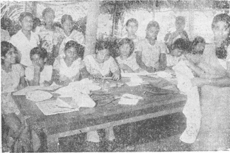
මෑ හුම් ගෙනුම් පුහුණුව ලබන තරුණියන්

ව්‍යාපාරය ආරම්භ කරන ලදී. තරුණියන් හය දෙනෙකු කොත්මලේ කඩදසි ආයතනයට යවා අභ්‍යාසමය පුහුණුවක් ලබා දී එම ව්‍යාපාරය ආරම්භ කරන ලදී. පිදුරු අමු ද්‍රව්‍යය විය. මෙම ක්‍රමය යටතේ කඩදසි නිපදවූවද, වෙළඳපලක් හා සෙසු කඩදසි හා තරඟ කළ හැකි නිමාවක් ලබා ගැනීම උගහට වීම නිසා ව්‍යාපාරය අත්හැරීමට සිදුවිය. රු. 2,000 ක් පමණ වැය කර ගත් උපකරණ අද කාමරයක අගුළු ලා ඇත. පොදු ප්‍රතිපත්තියක් යටතේ මෙම ක්‍රමය පණ ගන්වන්නේ නම් මිස උරාපොල වැනි කුඩා ඒකකයට එයට පණක් දිය නොහැක. ක්‍රියාකාරී පොදු පිළිවෙතක් යළි ඇති වන්නේ නම් කඩදසි ව්‍යාපාරයේ යළි නිරත වීමට තරුණයින් සූදනම්ය.