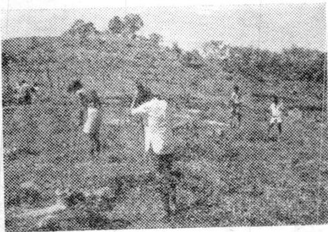
තරුණ සාමාජිකයෝ එකමුතුව වැඩ කරති.

අපි මෙහෙ වැඩ කරන්නේ කණ්ඩායම් වලට බෙදීලයි. එක් කණ්ඩායමක් අද කරන වැඩ තවත් දවසකදී වෙනත් කණ්ඩායමකට පැවරෙනවා. මේ විදියට හැම අංශයකම වැඩ ගැන සාමාජිකයන්ට දැනීමක් ලැබෙනවා.