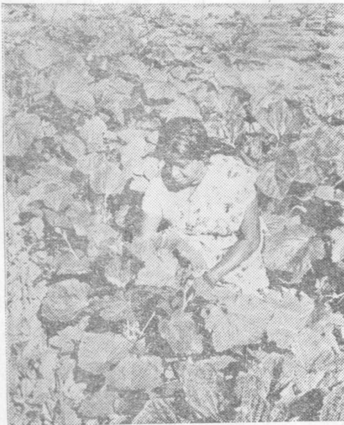
රත්මලානේ උඩුවෙල මහත්මිය බණ්ඩක්කා වගාවක නිරතව සිටී

‘අප ගෘහණියන් හැටියට ටිකක් උවමනා වෙන් කල්පනා කරලා බැලුවොත් ගෙදරට සැකසුරුවමකම සුළු සුළු දේවල් මගින් බොහෝ දුරට ඇති කර ගැනීමට පුළුවන්. මේ සඳහා එක් මාර්ගයක් ගෙවතු වගාව. අනෙක් අතට දැන් රටේ කොයි කාටත් අමාරු කාලයක්. එළවළුවල මිළ ගණන් දිනෙන් දින ඉහළ යනවා. ඇත්ත වශයෙන් ම පසුගිය ද කක්කාලි රාත්තලක මිළ රු.14.00 දක්වා ඉහළ ගියා. මේ කරුණු නිසාම යි. මා ගෙවතු වගාවට උනන්දු වන්නේ. එය ජීවන වියදම පහළ මට්ටමකට තබා ගැනීමට උදව් වෙනවා’.