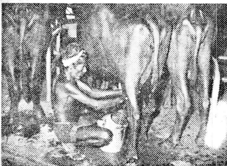
පොළොන්නරුව ගොවිපලේ කිරි දොවද

පිටි කිරි නිෂ්පාදනයේ අතින්යාදෙලොස් වන සියවස කේවා දිවගියත් උකු කිරිවල ඉතිහාසය ගත වර්ෂයකට එහා යන්නේ නැහැ. ලොව මුල්ම උකු කිරි කමහල ඇමරිකානු ජාතික ගේල් බොර්ඩන් පිහිටවුවේ 1856 දී මිනිසුන් අතරට ආ මුල්ම උකු කිරි වෙළඳ නාමය වුනේ 'රාජලියා'. මුල් කමහලට වැඩි ආයුෂක් තිබුනේ නැහැ. සෑර පදනමක උකු කිරි කමහලක් 1860 ගණන්වල දී ඇමරිකාවේ ඉදිවුණා. දන් ලොව හැමරටකම වාගේ උකු කිරි කමහල නියෙනවා.