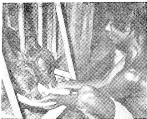
වසුපැටවුන්ට කිරි පොවන ගොවිපල සේවකයෙක්

පොළොන්නරුව මඩකලපුව පාරේ, කඳුරුවෙල පිහිටුවා ඇති සත්ව ගොවිපලේ බිම්