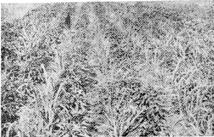
උක් සමග සරුවට වැවි ඇති මාළු මිරිස් වගාවක් - මෙයින් ඉතා ඉහළ අතුරු ආදායමක් ලබා ඇත

වලටයි දෙකටම ගැලපෙන දේශගුණයක් තමයි මේ විදිහේ අතුරු බෝග වගාවට හරි යන්නේ. උක් දඬුයි, එළවලුයි හිටවන කාලේ එකිනෙකට වෙනස් හින්දා, එළවළු පැල තවාන් හදා ගන්න ඕනෑ. ඊට පස්සේ උක් දඬු හිටවන්න ඉඩ තියලා වම්බටු, මාළු මිරිස්, පැල තවානෙන් ගලවලා පේලිවලට හිටවන්න ඕන. තක්කාලිවලට විතරක් පස් ටිකක් එකතු කරලා බිම උසට හිටින විදිහට පැලය හිටවන එක වඩා හොඳයි. අතුරු වගාව අතරේ පහත තියෙන තරමට ඉඩ හියන්න ඕන.