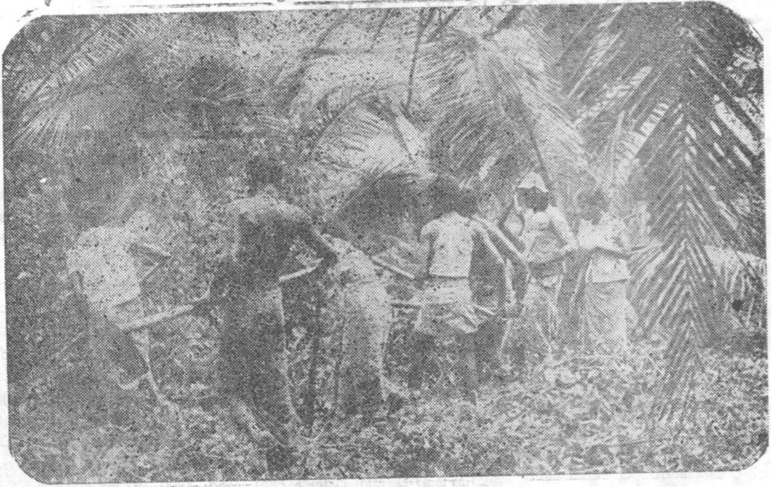
ගොවිතැනේ ආරම්භය: වල් කෙටීම